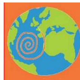
Le Média du voyage durable